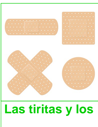
Las tiritas y los