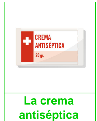
La crema antiséptica