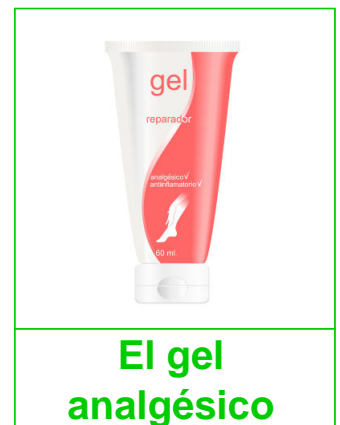
El gel analgésico