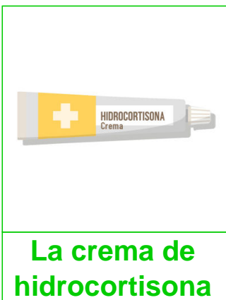
La crema de hidrocortisona