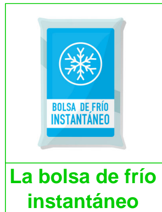
La bolsa de frío instantáneo