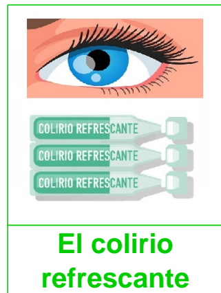
El colirio refrescante