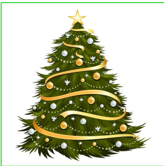
Árbol de navidad