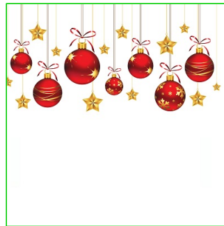
Bolas de navidad