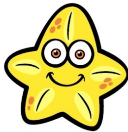
Estrella de mar