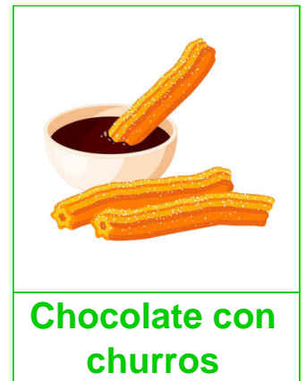
Chocolate con churros