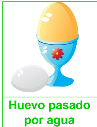
Huevo pasado por agua