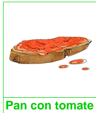
Pan con tomate