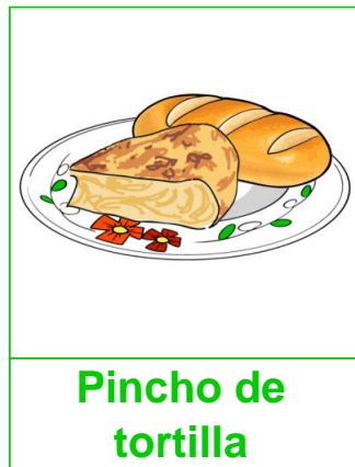
Pincho de tortilla