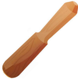
La mano de mortero