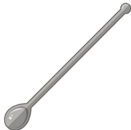
La cuchara de coctel