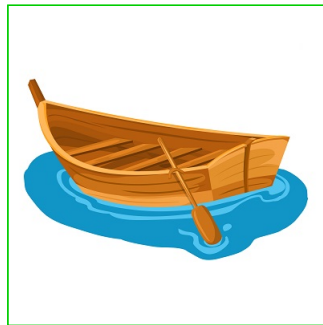
Bote de remos