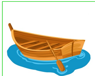
Bote de remos