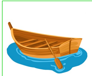
Bote de remos