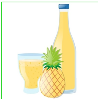
Zumo de piña