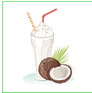
Crema de coco