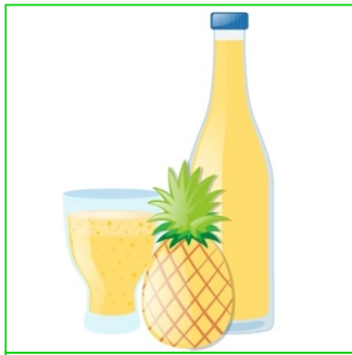
Zumo de piña