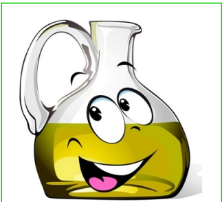
Aceite de oliva