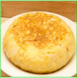
Tortilla de patatas