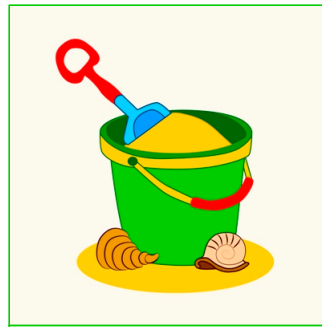
El cubo y la pala