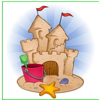
Castillo de arena