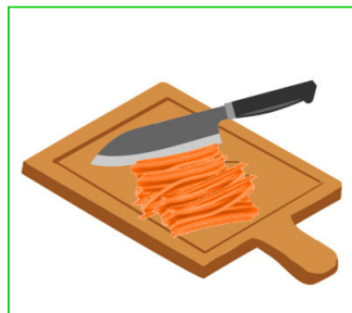
Cortado en juliana