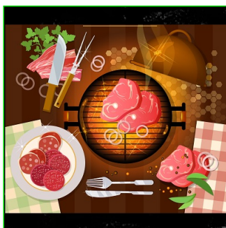
A la parrilla