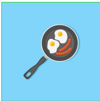
Frito con poco aceite